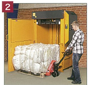
2. 簡単なベールの取り扱い