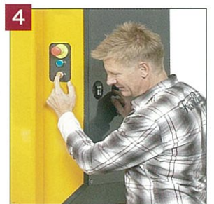
4. 両手操作の安全設計