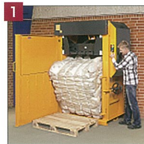
1. ボタン操作で梱包物排出