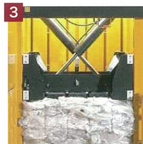
3. クロスシリンダーの採用