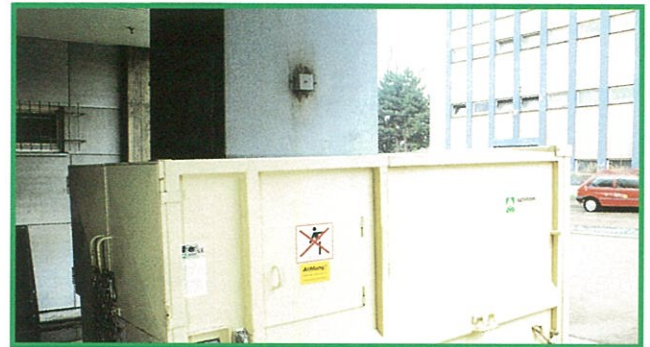
MPC5 P/E 家庭用接続ホッパー