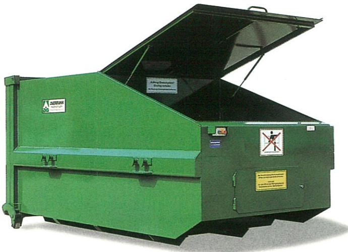
MPC5 P/E カバー付