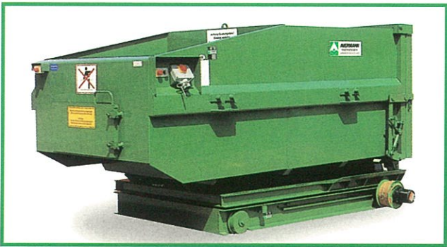
電気駆動型移送装置に搭載された MPC5 P/E