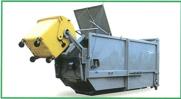
MPC10 P/E 持ち上げ排出装置